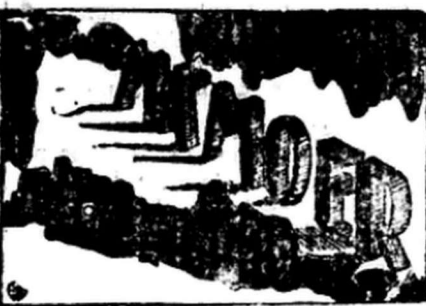
Pange an Soemedangweg No. 117 Bandoeng

Djoega trima besnaren. HARGA BERSAINGAN. Leder Perbi mendapat harga special.