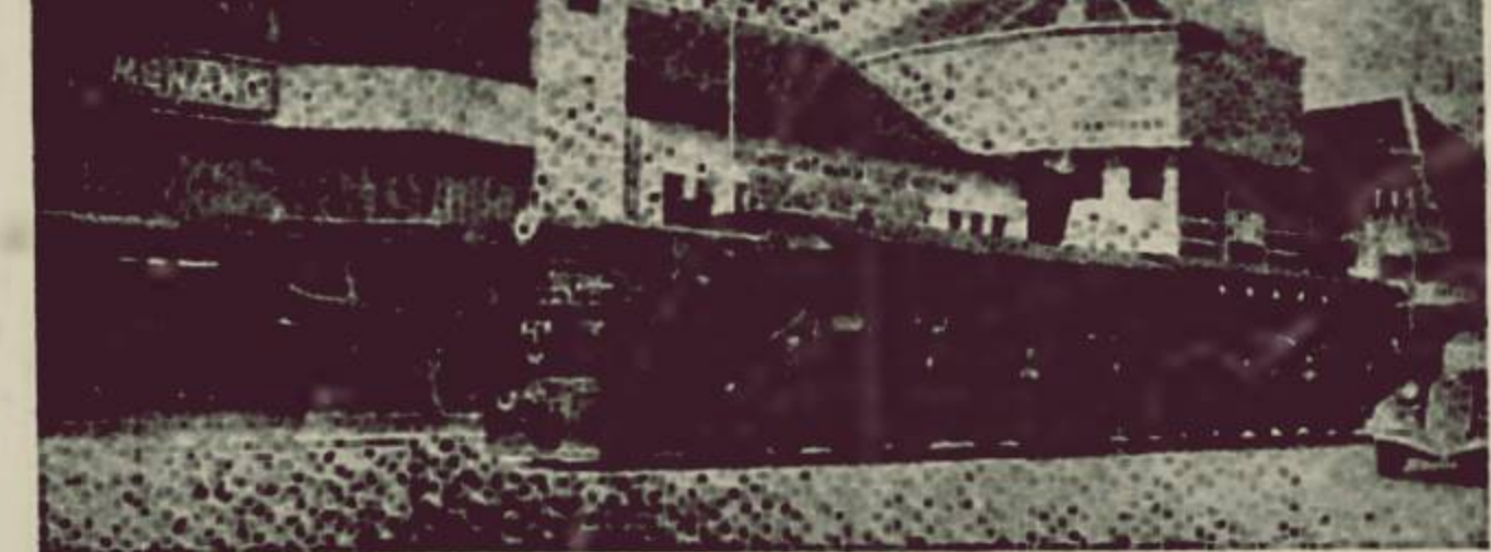
Tram kota Semarang yang ini hari soeda linjap boeat selama-amanja.

Djoega dari pihaknja S.J.S. sendiri telah diambil slamet berpisa dari tram kota. Boeat ini maksoed, maka telah disediakan satoe wagon, special boeat pembehar-pembar dar S.J.S. dan Zuster-Mantschap. Toean Stapel, hoofvertreter-gemeenteraad dari Zuster-Mantschappen poen berada di antaranja itoe pembehar-pembar dari S.J.S. yang doedek dalem wagon tersebut merasaken boeat paling bagus, bagimana senengnja orang naik tram kota Semarang.