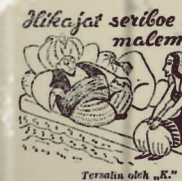
Tersalin oleh "K"