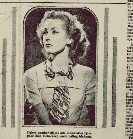
Dalem gambar diatas ada dilekibden tjara pake dadi menoreot molo pating blakang.