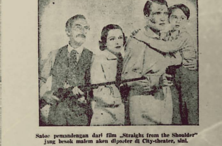
Sate pemandangan dari film "Straight from the Shoulder" jang beot meleni akan diposter di City-theater, sinl.