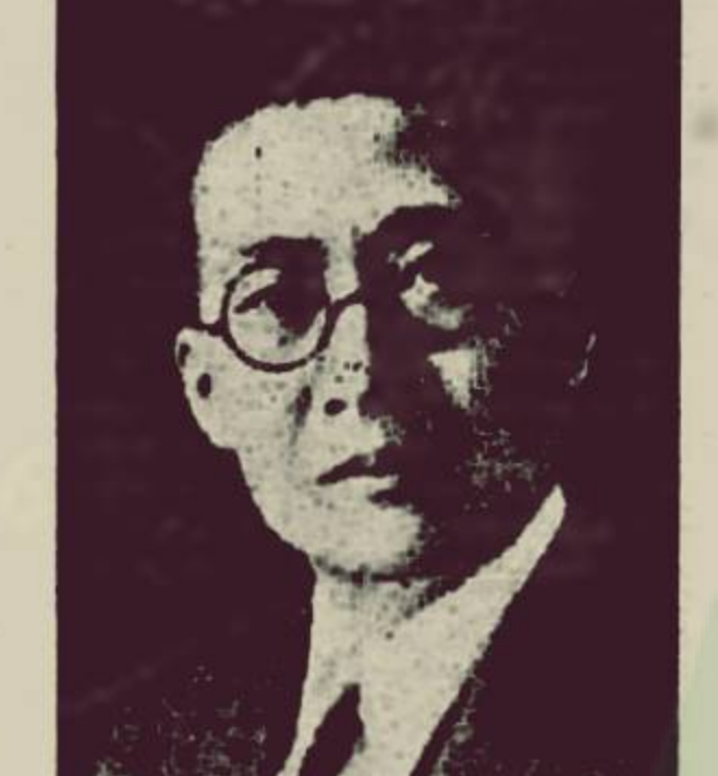
GENERAL WU TE CHEN. Burgemeester dari Greater Shanghai.

Voorstelnja pamerenta dan sikepnja koem madjikan serta koem boeroeh.