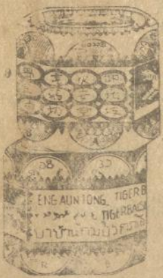
Dalem goetji ketjil merah dan poeti

Obat tjap Matjan tide boleh tida ada di toean poenja roemah, kerna tida ada obat lebih baek boeat semboehken Rheumatiek, sakit boekoe toelang dan spier, kasaleo dan pilek dari pada ini obat oermeem. Djoega boeat laen-laen penjakit dan ganggoean obat tjap Matjan ada mandjoer. Tjoba soeroe toean poenja boedjang beli boeat satalen satoe goetji ketjil Obat Matjan. Toean pasti aken dapet kafaedahan dari ini.