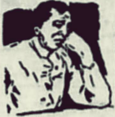
Pil Foster boeat peroet besar (Foster's Maggillen) boleh didapat disemoea roemah obat dan toko. Harganja f0.80 sebotol.

rang boekti terseboet diatas pa-da persakitan serta tanjakan apa ia betoel soedah melakoeken itoe pentjoerian, persakitan lantes me-njahoet dan mengakoe teroes te-rang kesalahannja.