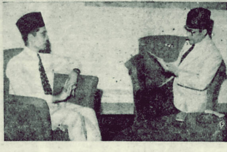
Presiden Sukarno kemarin dulu malam menerima dengan baik mandat jang diserahkan kembali oleh Perdana Menteri Natsir. (Antara).