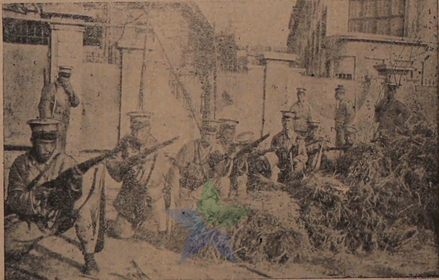
Di djalanen dari Shanghai pasoeakan Tionghoa lagi maloemken perang hebat sama pasoeakan Djepang.

Rapport ditoelis nom. S.H.S. ready Soer. f 6,45 H.S. " " " 6,42