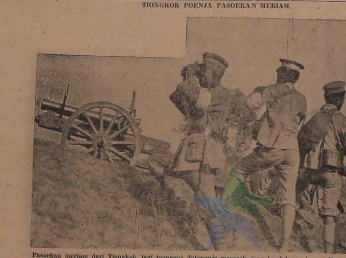
Pasoean meriam dari Tionghok lagi toenggoe datengnja moesoch jang hendak menjerang Shanghai.