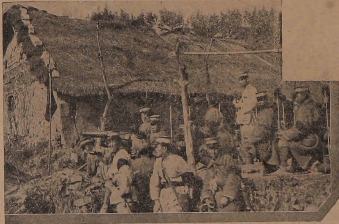
Perklalan di Shanghai dan sekternja soedah dimaloemken lagi dengan hebat sekali. Di gambar atas bisa dilihat satoe pasoeakan Tionghoa lagi bersedia boeat sambot kedatengannya pasoeakan Djepang. Pemimpin - pemimpin pasoeakan Tionghoa ambil poetoesan boeat belaken negeri dan bangsanja sampe di saat jang paling penghabisan.

Salatiga, 21 Mrt (Aneta). „A. I. D.” wartaken jang goe-roe prampoean H. I. S. Djoa namanja, tadi pagi oleh oppas, jang dapet tjomelan, soedah diserang dengan piso, hingga metken loeka-loeka jang bahaja. Djoega si penjerang sendiri dapetken loeka.