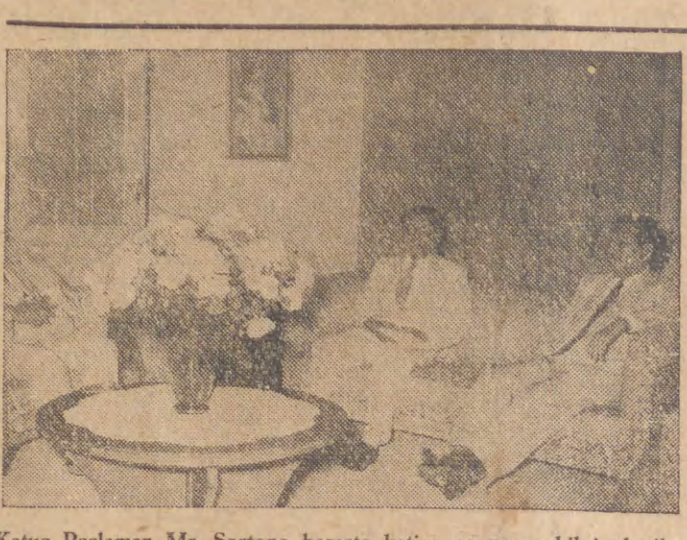
Ketua Parlemen Mr. Sartono beserta ketiga orang wakilnya ketika mengunjungi Wk. Presiden Moh. Hatta ditempat kediamannya di jalan Merdeka Selatan. Maksud kunjungan tsb. ialah menyetujui surat penghargaan atas jasa2 beliau.