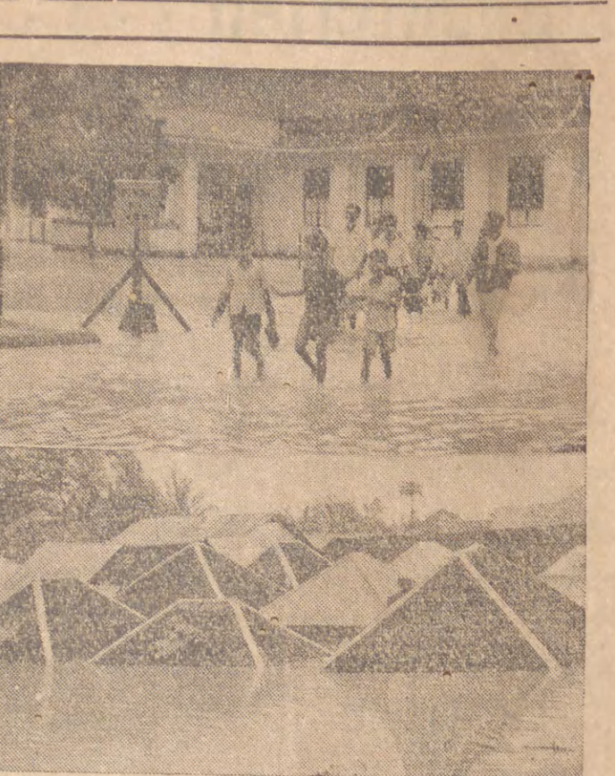
BANDIR BESAR DI MEDAN. Gambar atas: Orang2 dari rumah sakit Deli Maatschappij Medan sedang mengungsi. Gambar bawah: Kampung Aur satu kompleks rumah sakit jang terletak dijalan Istana Medan akibat banjir jg tingginya 4 1/2 M. banjir kelihatan atapnya saja.

Polisi Sesalkan Pemerintah Kru Selu Tinggalkan P3RI Bila Ambil Puntusan2 Mengenai Soal2 Kepolisian. 'ANTARA' mendapat kabar, bahwa dalam hubungan dengan adanya R.U.U. tentang pimpinan Kepolisian Kehakiman dan Kejaksaan Djaksa Agung, Penjurusan Besar 'Pusat' Pegawai Polisi R.I.' telah menandatangani kepada Pemerintah tentang soal2 kepolisian yang diambil dalam rapatnya baru2 ini di Semarang yang pada pokoknya menesalkan finkand2 Pemerintah yang semestinya menengalkan P3RI dalam menuntaskan persoalan2 prinsipil yang banyak berkaitan dengan Kepolisian dan dengan tegas menuntut, agar Pemerintah meninjau kembali ke putusan Dewan Menteri seketika tentang undang2 pimpinan Kepolisian Kehakiman dan Kejaksaan Djaksa Agung dengan menengalkan pendapat2 dari P3RI.