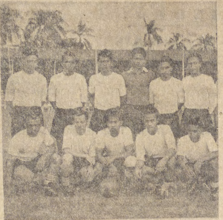
PSSI-MUDA. Inilah banga-harapan dari PSSI-Muda yang dapat menggulingkan XI Saja dari S'pura dengan 4-3.

Umat Kristn menghendaki susunan negara seperti yang sekarang, jikalau yg berdasarkan Pantjasila, oleh karena didalam negara berdasarkan Pantjasila ini hak2 manusia telah djanjiaan, demikian diterangkan Undang K.S.M., s.l.h seora g tokoh Parkindo dalam pertemuan umum Parkindo di Gedung Olah-raga Djakarta. — Ant.