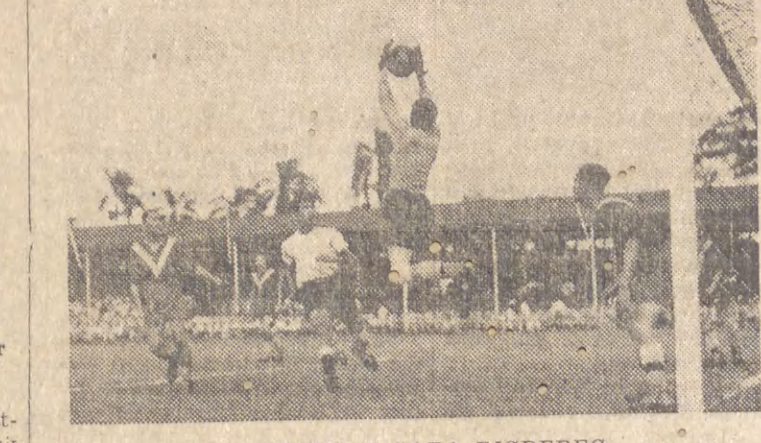
BENTENG SAFA DIGREBEG. Gambar diatas ini menunjukkan penjaga gawang Safa dari S'pura sedang menghindari bahaya karena serangan muka tengah PSSI-Muda.

Usaha serupa itu sudah barang tentu memerlukan biaya. Dalam hal ini Kementerian P.P.