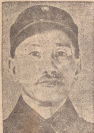
Mac Arthur ke Formosa.

Berita terakhir dari Markas Besar Djendral Mac Arthur mengatakan, bahwa balabantuan Amerika Serikat kemarin telah didaratkan di Korea. Dimana mereka mendarat tidak diumumkan. Balabantuan ini langsung didatangkan dari Amerika untuk memperkuat tentara A.S. yang kini telah bertempur di Korea karena terus menerus mendapat pukulan dari pasukan2 Utara sehingga mereka hingga sekarang terpaksa terus bergerak mundur.