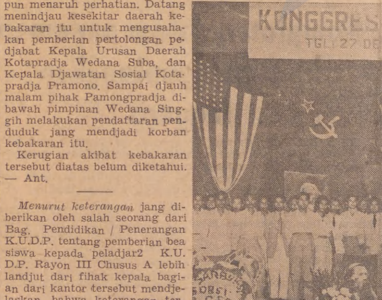
Baru2 ini bertempat di Balai Pertemuan Umum Djakarta telah dilangsungkan malam resepsi Kongres ke-III oleh "Sarbupri". Gambar: D.P.P. digami bar bersama. (IPPHOS).

Wilayah Djawa Tengah Kotapradja untuk menoleng menjukupi kebutuhan rakjat; perbaikan lapangan olah raga; Pembagian tanah partikelir kepada rakjat yang sangat membutuhkan seluas 300 ha.; Disamping itu diadakan perbaikan djalan2 diatas tanah partikelir itu. Demikian wakiltota Semarang.